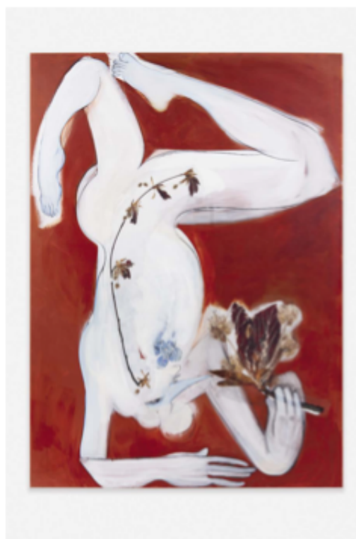
Carlotta Bailly-Borg, Empathy , 2021, acrylverf, digitale prints getransfereerd op canvas, 180 x 130 cm

Carlotta Bailly-Borg, Trouble , tot 19 februari, curator Evelyn Simons, Ballon Rouge, Brussel. www.ballonrougcollective.com Carlotta Bailly-Borg, Family Affair , tot 27 februari, curator Evelyn Simons, gepresenteerd door Ballon Rouge in Vitrine, Basel. www.vitrinegallery.com